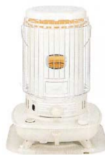
対流型石油ストーブ

注意 火傷注意! ライト部分は点灯中あるいは消灯直後は熱いので手を触れないでください。 火傷注意! 稼動中はエンジン部・マフラーが熱いので手を触れないでください。