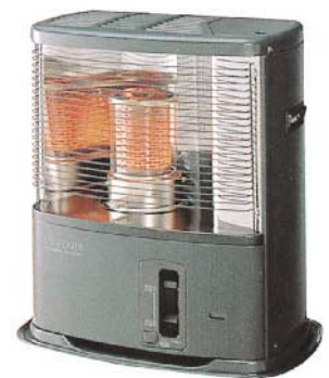
大型石油ストーブ

注意 火傷注意! 稼動中は本体が熱くなるので注意 手を触れないでください。 火災注意! 燃えやすい物の周囲で使用しないで下さい。